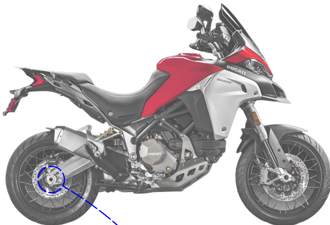
Immagine usata a fini esclusivamente illustrativi Image used for illustrative purposes only

ATTENZIONE: Il montaggio del prodotto deve essere eseguito da personale specializzato WARNING: The mounting of the product it must be realized from staff specialist